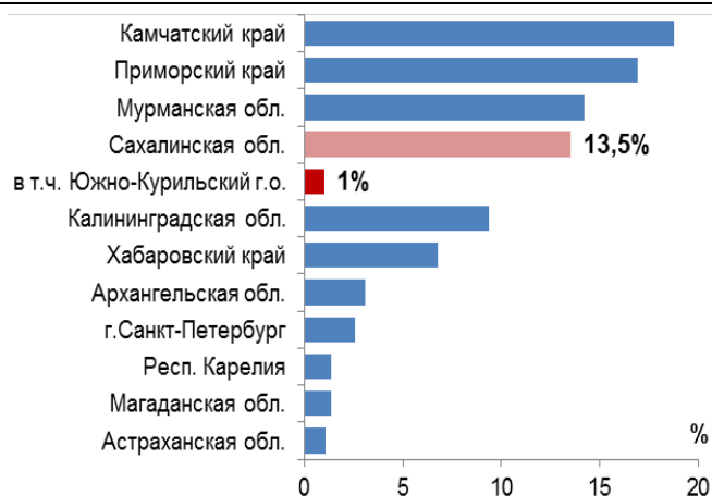
Рис. 2. Доля отдельных регионов в производстве рыбы и переработанных и консервированных рыбных продуктов России в 2015 г., в %