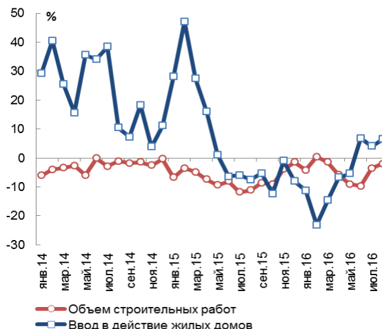
Динамика объема строительных работ и ввода в действие жилых домов в январе 2014 г. – августе 2016 г., в % к соотв. периоду пред. года

Поддержку рынку продолжает оказывать государственная программа льготного автокредитования. По последним данным Минпромторга, за период с начала года до 28 августа по льготной ставке было реализовано около 179 тыс. автомобилей (почти 20% всех новых автомобилей).