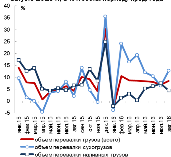
Темпы роста перевалки грузов в январе 2015 г. – августе 2016 г., в % к соотв. периоду пред. года

Сокращение пассажирских авиаперевозок происходит прежде всего за счет малых авиакомпаний, а доля лидеров на рынке авиаперевозок постоянно растет. Так, доля крупнейших 5 авиакомпаний в общем числе перевезенных российскими авиалиниями пассажиров в январе-августе 2016 г. составила 67,1% по сравнению с 52,5% в том же периоде годом ранее. При этом доля «Аэрофлота» увеличилась за тот же период с 27,0% до 32,6%.