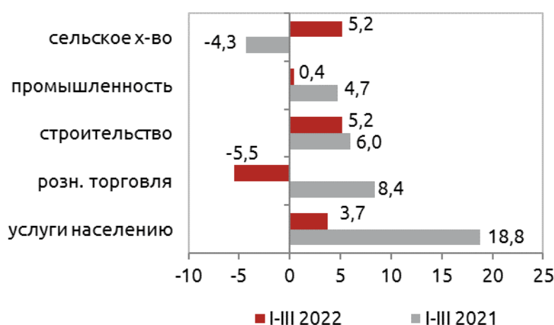
Рис. 1. Изменение выпуска* в основных секторах экономики России в январе-сентябре 2021-2022 гг., в % к соотв. периоду пред. года

*Для строительства – изменение объема строительных работ, розничной торговли – изменение розничного товарооборота, услуг населению – изменение объема платных услуг.