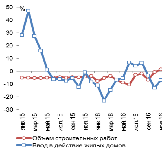
Ввод в действие жилых домов и объемы строительных работ в январе 2015 г. – ноябре 2016 г., в % к соотв. периоду пред. года