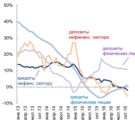
Темпы роста кредитной задолженности и депозитов физических лиц и нефинансового сектора (без учета курсовой переоценки) в январе 2013 г. – ноябре 2016 г., в % к соотв. периоду пред. года