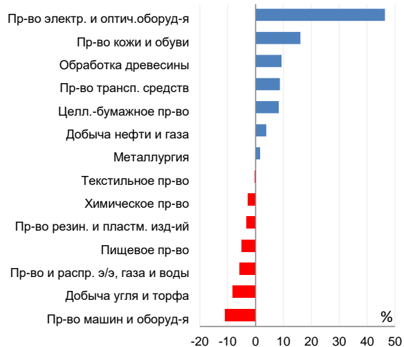
Изменение удельного потребления электроэнергии на единицу стоимости произведенной продукции для различных отраслей в 2015 г. по сравнению с 2013 г.

Среди добывающих и обрабатывающих производств наибольшее увеличение энергоёмкости в 2013-2015 гг. было характерно для производства электронного, оптического и электрооборудования (на 46,4%), производства кожи, кожанных изделий и обуви (на 16,1%) и деревообрабатывающей промышленности (на 9,3%). Наибольшее снижение энергоёмкости производства можно отметить в производстве машин и оборудования – на 11,1% в 2013-2015 гг.