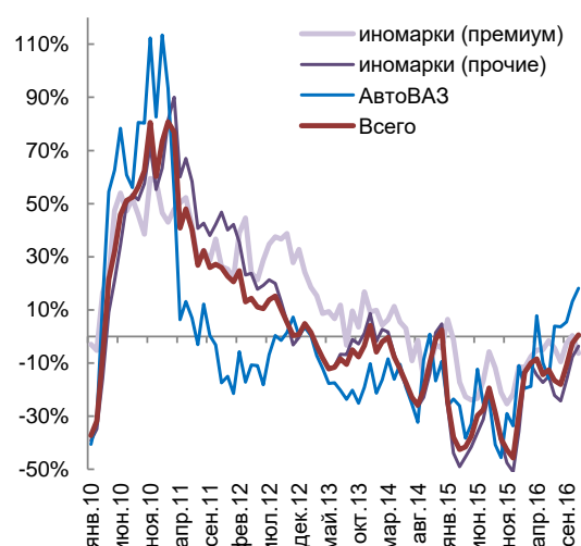
Темпы роста продаж легковых автомобилей и LCV в 2010-2016 гг. (в % к соотв. месяцу пред. года)