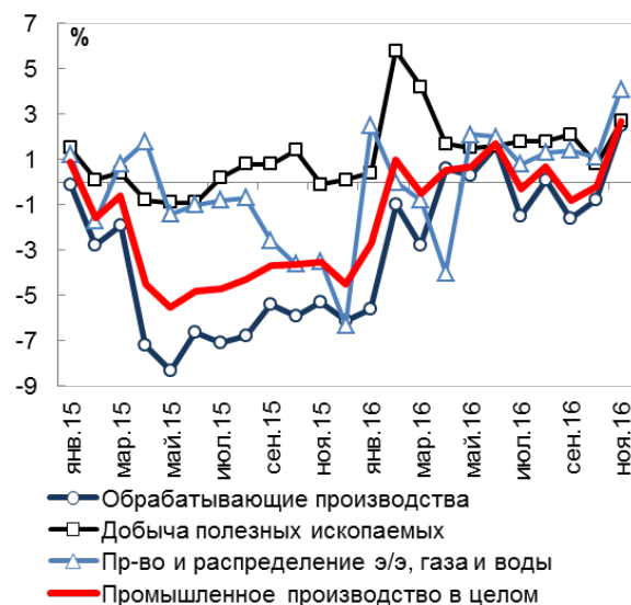
Индексы промышленного производства по видам экономической деятельности в январе 2015 г. – ноябре 2016 г., в % к соотв. периоду пред. года