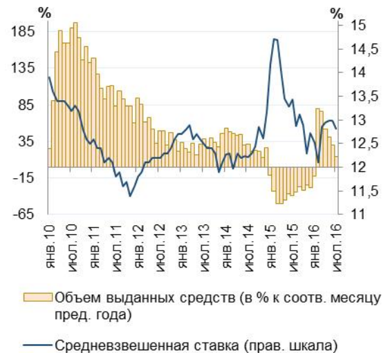
Темпы роста объемов выдачи рублевых ипотечных кредитов и средний уровень процентных ставок в 2010-2016 гг.

Страховые выплаты во II квартале 2016 г. составили 127,8 млрд. руб. (+3,3%) Основной вклад в рост этого показателя внесли выплаты по ОСАГО (около 33% всех выплат). При этом из-за повышения страховых лимитов рост объемов выплат по ОСАГО ускорился до 44,1% в годовом выражении.