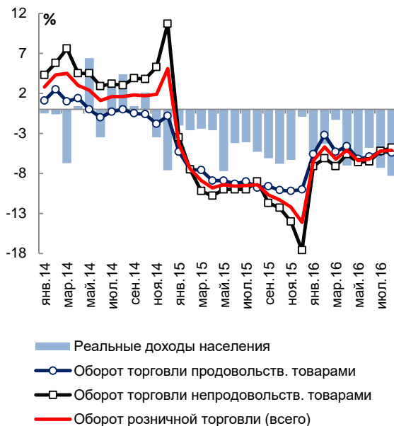
Темпы роста оборота розничной торговли и реальных доходов населения в январе 2014 г. – августе 2016 г., в % к соотв. периоду пред. года

Одновременно с падением реальных доходов населения в августе 2016 г. продолжилось сокращение оборота розничной торговли – на 5,1% в годовом выражении. Оборот розничной торговли продовольственными товарами в августе 2016 г. упал на 5,4%, непродовольственными товарами – на 4,8% к соответствующему периоду прошлого года, несмотря на низкую базу августа 2015 г. Среди основных продовольственных товаров значительно сократились, в частности, продажи рыбы и морепродуктов (-5,5% в годовом выражении), муки (-2,9%) и мяса птицы (-1,8%). Среди непродовольственных товаров существенно упали продажи обуви (-13,5% в годовом выражении), мебели (-12,4%), телевизоров (-7,4%), лекарственных средств (-6,2%) и легковых автомобилей (-2,4%). Согласно пересмотренному прогнозу МЭР, по итогам 2016 г. оборот розничной торговли сократится на 4,6%.