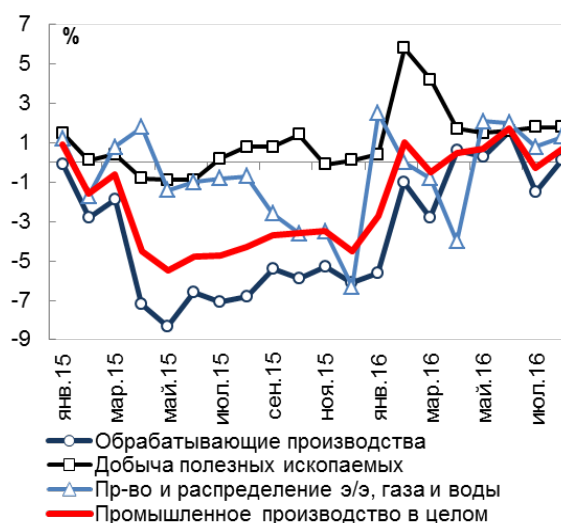
Темпы роста промышленного производства по видам экономической деятельности в январе 2015 г. – августе 2016 г., в % к соотв. периоду пред. года