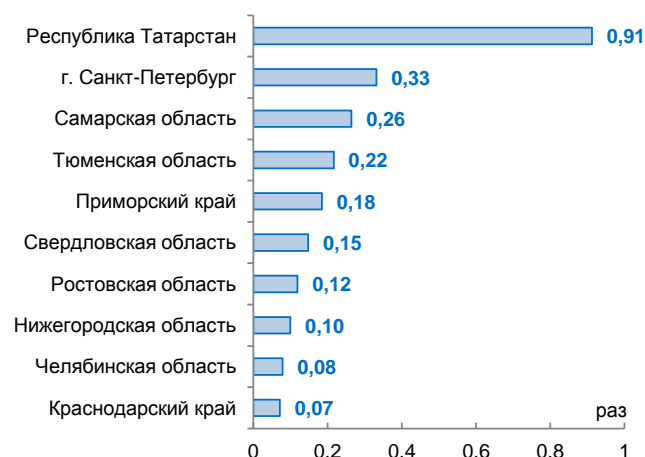
Рисунок 2. Отношение объема кредитов, выданных банками региона, к объему задолженности региональных заемщиков (2014)