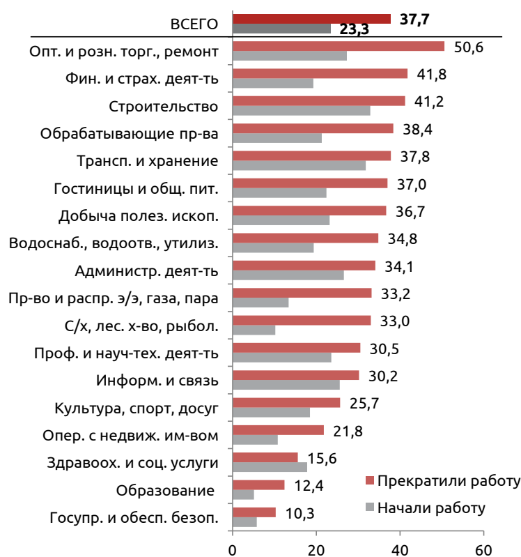
Рисунок 2. Число организаций, начавших и прекративших работу в I квартале 2017 г. (в расчете на 1000 организаций по соответствующему виду деятельности*)

Оценка «ротации» юридических лиц в расчете на 1000 организаций по соответствующему виду деятельности (см. рисунок 2) показывает, что «выбытие» организаций было в наибольшей степени характерно для таких секторов, как торговля, финансовая и страховая деятельность, строительство и обрабатывающие производства. При этом среди обрабатывающих производств наиболее высокие показатели выбытия характерны для производства кокса и нефтепродуктов (57,4 организации на 1000 действующих), обработки древесины (54,2), металлургических производств (45,3). В свою очередь, наиболее активное появление новых организаций было характерно для строительства (32,9 новых организации в расчете на 1000 действующих), сектора транспорта и складского хозяйства (31,8), оптовой и розничной торговли (27,3).