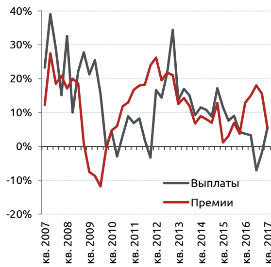
Изменение страховых премий и выплат по всем видам страхования (кроме ОМС) в 2007-2017 гг. (в % к соотв. кв. пред. года)

Страховые выплаты в I квартале 2017 г. выросли на 5,5% в годовом выражении и составили 123,5 млрд. руб. Вследствие повышения страховых лимитов выплаты по ОСАГО продолжают увеличиваться – в I квартале 2017 г. они выросли до 52,4 млрд. руб., или на 47,3% в годовом выражении. Таким образом, за год доля ОСАГО в общем объеме выплат выросла до 42,2% (с 30,4%). При этом объем выплат по ОСАГО превышает объем собранных премий по данному виду страхования.