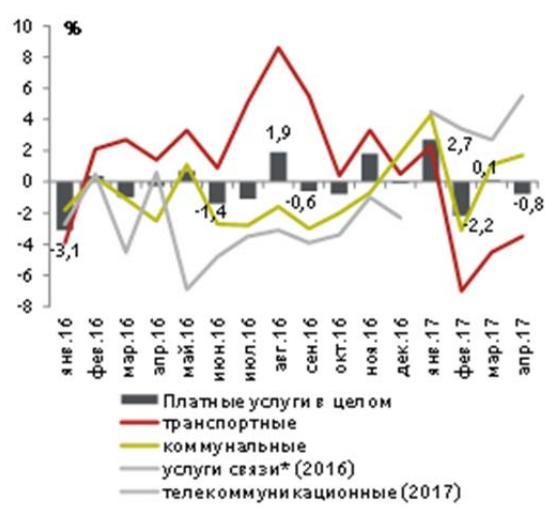
Объемы платных услуг населению в России в январе 2016 г. – апреле 2017 г. (в % к соотв. периоду пред. года)

* С 2017 г. разделены на телекоммуникационные услуги (более 95% услуг связи в целом), а также услуги почтовой связи и курьерские услуги.