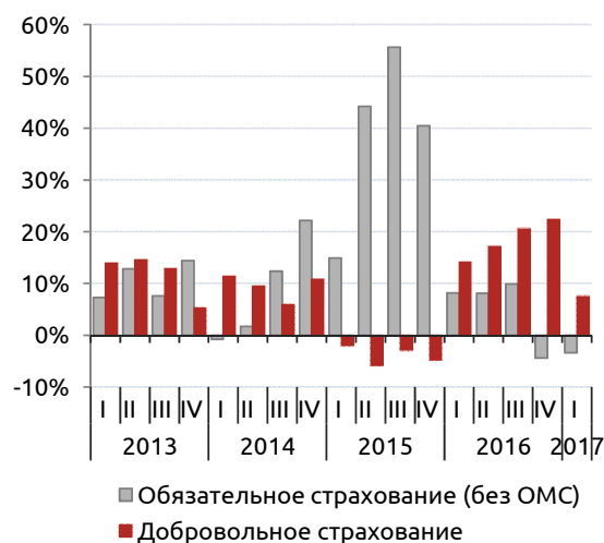
Страховые премии по обязательным и добровольным видам страхования в 2013-2017 гг. (в % к соотв. кв. пред. года)