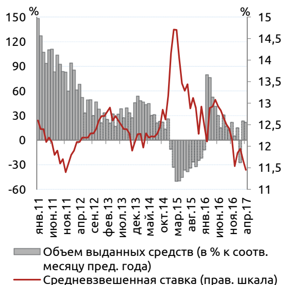
Объем предоставленных ипотечных кредитов в рублях в течение месяца (в % к соотв. месяцу пред. года) и средневзв. процентная ставка по ним

Между тем, продолжается снижение процентных ставок по ипотечным кредитам со стороны основных участников рынка. Так, средневзвешенная процентная ставка по ипотечным кредитам в рублях, выданным в течение месяца, составила в апреле 11,45% – это минимальное значение показателя с ноября 2011 г. При этом, согласно данным Агентства по ипотечному жилищному кредитованию (АИЖК), ставки в 15 крупнейших банках по объему выдачи ипотечных кредитов в апреле опустились до рекордно низкого уровня: на первичном рынке – до 10,64%, на вторичном – до 11,18%. Сейчас ставки продолжают падать. С 1 июня Сбербанк запустил программу для молодых семей со ставкой 9,5% (при этом, по заявлениям Г. Грефа, в среднем базовая ставка сейчас составляет 10-10,5%), банк ВТБ24 с 7 июня также снизил ставки до 10%. Большинство участников рынка сходятся во мнении, что к концу года средняя ставка установится на уровне 9-10%. По мнению гендиректора АИЖК А. Плутника, в течение двух лет возможно снижение ставки по ипотечным кредитам до 6-7%. Тем не менее, по оценкам главы ВТБ24 М. Задорнова, такая ставка возможна лишь при установлении инфляции на уровне 2%. Смягчение условий кредитования (снижение ставок и требований к размеру первоначального взноса) способствует восстановлению ипотечного рынка, однако вряд ли здесь можно будет ожидать